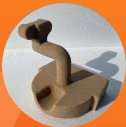
ПЕСЧАНЫЕ ФОРМЫ, СТЕРЖНИ