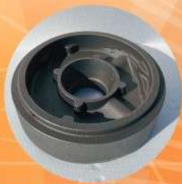
ПОСУДА, КОРПУСНОЕ ЛИТЬЕ