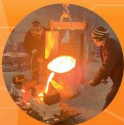
ПРОЦЕСС РАЗЛИВКИ МЕТАЛЛА