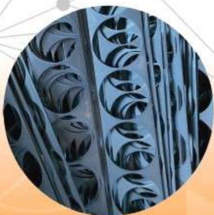
ШИХТА – ПРОМЫШЛЕННЫЕ ОТХОДЫ